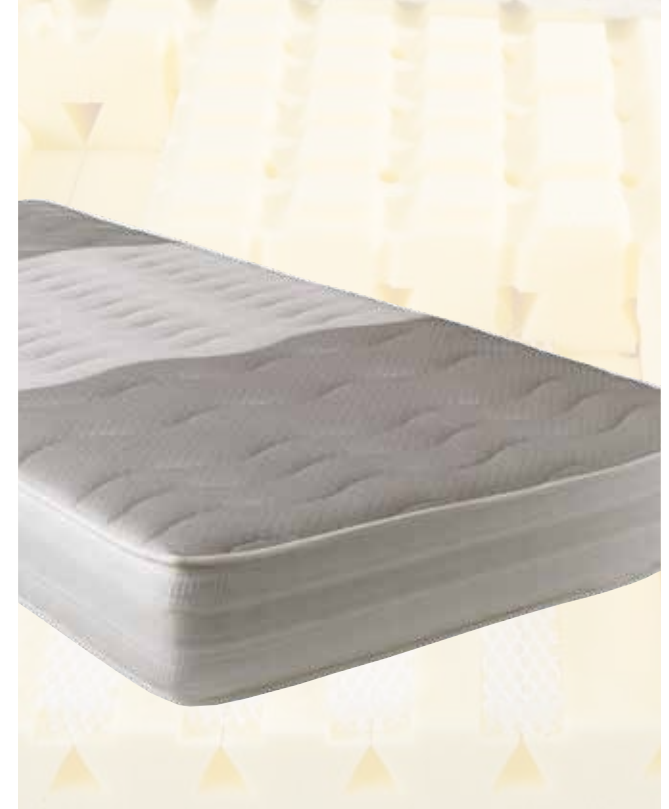
dormabell Innova Air S 16 Perfekte Ergonomie und optimales Schlafklima SCHAUM-MATRATZE