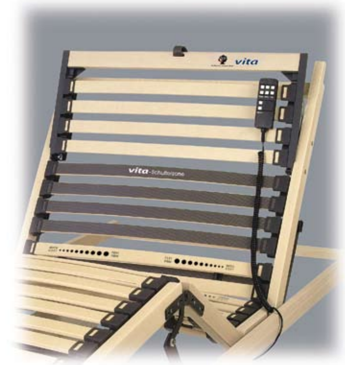
DER DORMABELL RAHMEN VITA